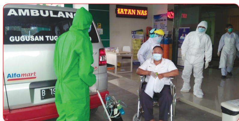
Layanan mobil ambulance gratis dari Alfamart untuk pasien Covid-19 di Banten.