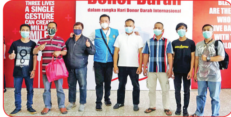
Panitia penyelenggara berfoto bersama para pendonor setelah mendonorkan darah.