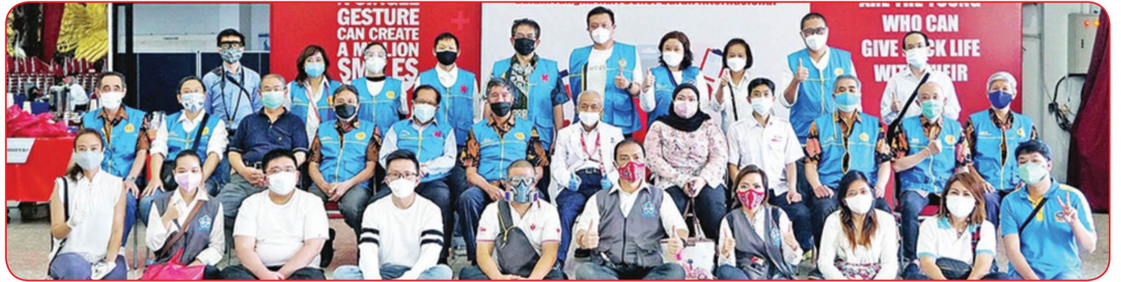
Panitia penyelenggara berfoto bersama dengan staf medis PMI Bandung.