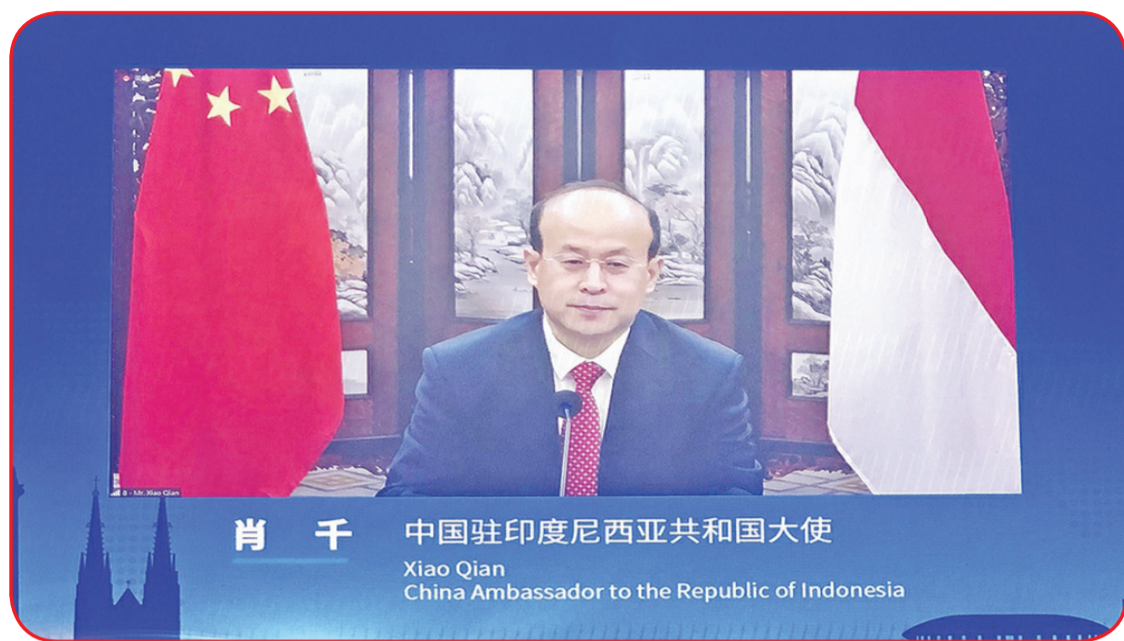
Dubes Tiongkok untuk Indonesia Xiao Qian.